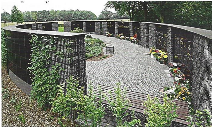
Urnen-Insel in Gröditz: Kammern sind eingebettet in Gabionenkörbe.

Die von und mit Weiher geplanten und gebauten Objekte erfüllen hohe Ansprüche und finanzieren sich für die Kommunen in überschaubarem Zeitrahmen. Die kompletten Anlagen werden ausschließlich