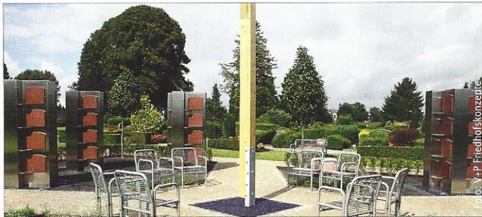
Kreuz- und Rundstelen aus Edelstahl im Friedhofsaußenbereich.