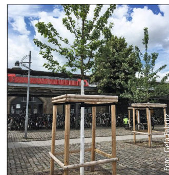
Novihum als Bodenverbesserer.

Gefa Produkte Fabritz (47800 Krefeld) bietet mit dem Dauerhumuskonzentrat Novihum einen wertvollen Dünger für Stadtbäume und Pflanzungen im urbanen Raum mit ihren schwierigen Standortbedingungen oder für Dachbegrünungen. Um eine dauerhafte Nährstoffversorgung unabhängig von regelmäßiger Düngung sicherzustellen, sollte schon bei der Grundsicht Novihum eingearbeitet werden. Es wirke dort langfristig als Bodenverbesserer. Die Folge: stärkere Wurzelentwicklung und beschleunigtes Wachstum, erhöhte Widerstandsfähigkeit und Wassernutzungseffizienz sowie höhere Austauschkapazität der