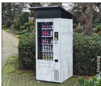
Grablichter aus dem Automaten.

Hensing (48282 Emsdetten), ein Anbieter von Verkaufsautomaten, hat „Grablicht-Boxen“ entwickelt, die mit bis zu 350 hochwertigen Grablichtern unterschiedlicher Preiskategorien ausgestattet sind. So kann jeder Friedhofsbesucher jetzt rund um die Uhr ein Grablicht kaufen und aufstellen. Hensing hat sich bei der